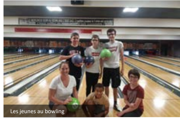
Les jeunes au bowling

En attendant de vous retrouver nombreux cet été à la Maison de la Jeunesse, toute l'équipe d'animation vous souhaite de belles vacances.