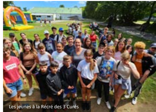
Les jeunes à la Récré des 3 Curés