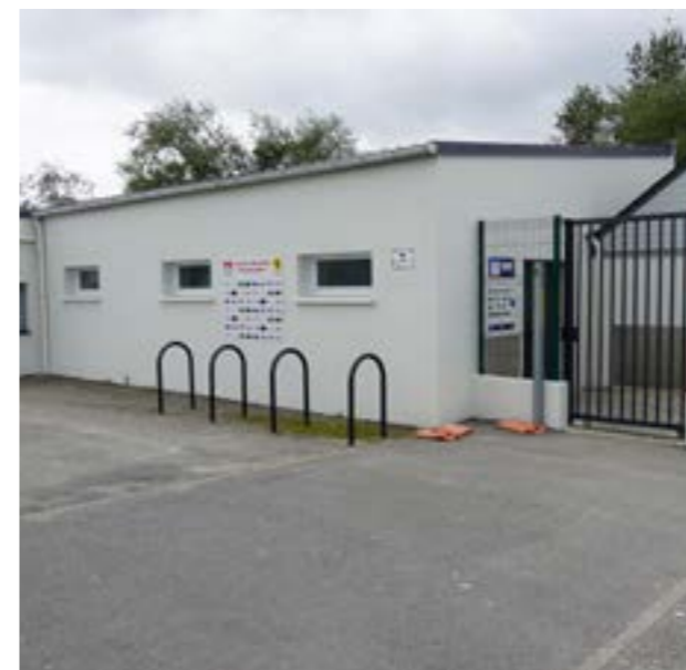
Ravalement du vestiaire à Lokournan