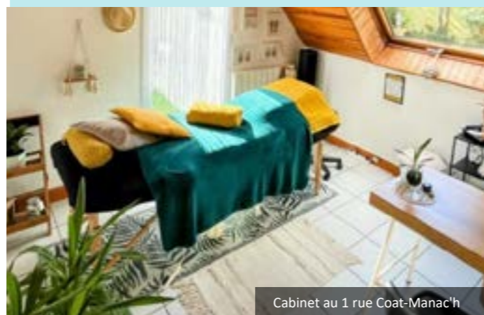
Cabinet au 1 rue Coat-Manac'h

https://www.laetitia-alcalde-reflexologue.fr/