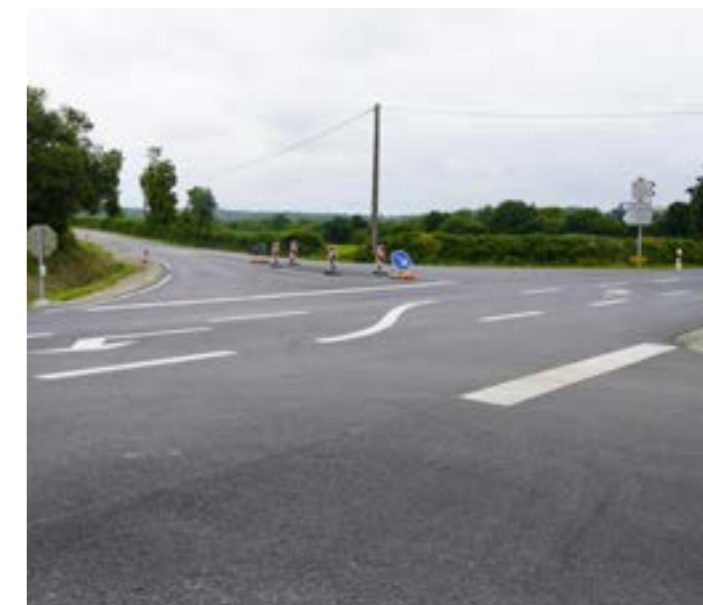
Rénovation de la RD27 direction Brèles par le Conseil départemental du Finistère