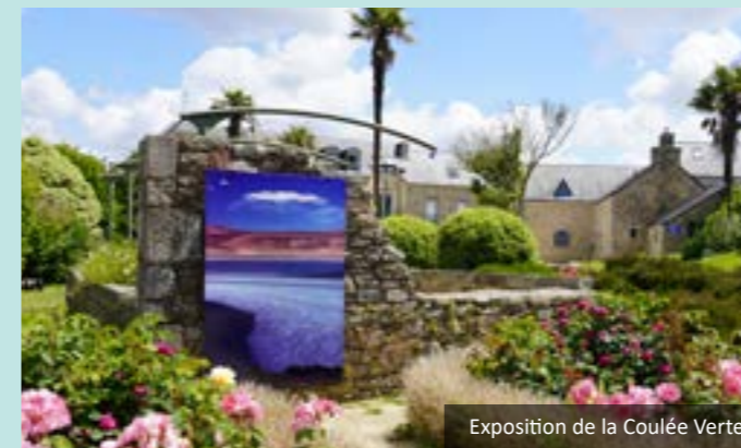
Exposition de la Coulée Verte