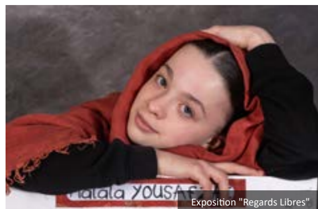
Exposition "Regards Libres"