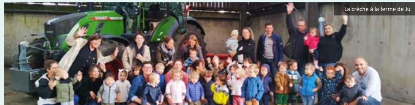
La crèche à la ferme de Ju

Bonne route aux enfants qui quittent la structure pour prendre le chemin de l'école ainsi qu'à leur famille ! Bel été et bonnes vacances à tous les enfants et familles des Diabolins.