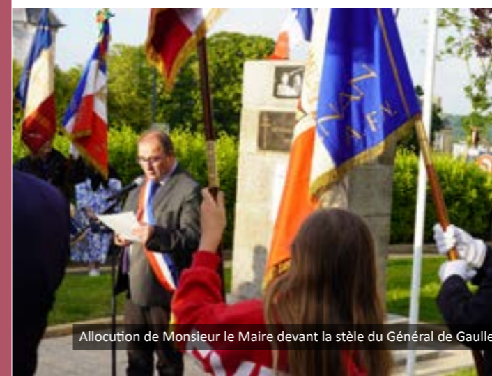
Allocution de Monsieur le Maire devant la stèle du Général de Gaulle