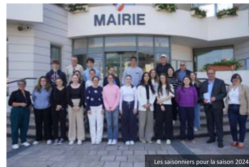
Les saisonniers pour la saison 2024