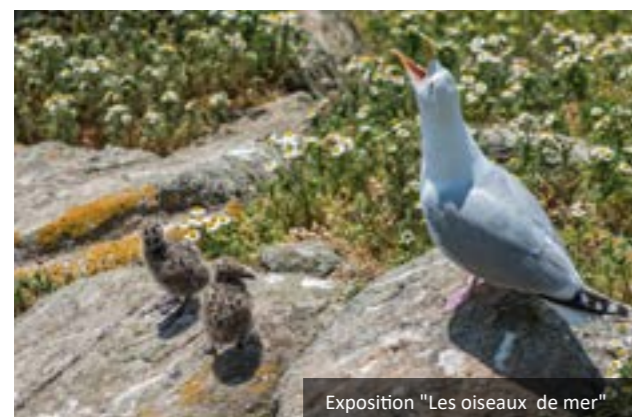
Exposition "Les oiseaux de mer"