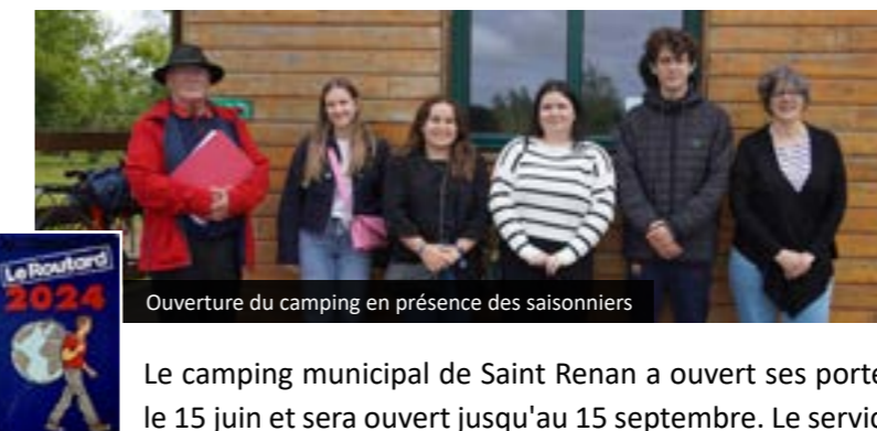
Ouverture du camping en présence des saisonniers

Le camping municipal de Saint Renan a ouvert ses portes le 15 juin et sera ouvert jusqu'au 15 septembre. Le service des espaces verts a préalablement tout mis en œuvre pour assurer le meilleur accueil aux touristes.