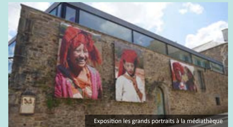
Exposition les grands portraits à la médiathèque

Venez à la découverte de grands portraits qui invite le public à voyager autour du monde. La déambulation permet également de découvrir les autres expositions de la ville.