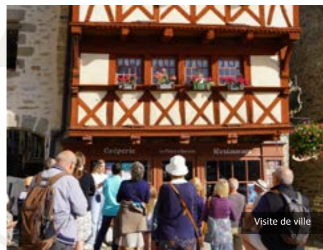
Visite de ville