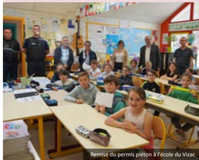
Remise du permis piéton à l'école du Vizac

Au total, 142 élèves ont été formés et diplômés.